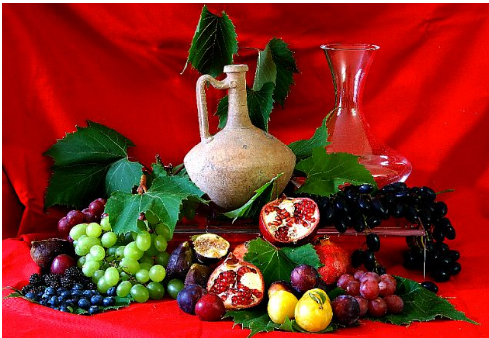
Il decanter romano

Un decanter romano, un “kantharos” (coppa) etrusco, un’anfora del I secolo a.C. e una brocca medievale: sono quattro degli elementi più preziosi custoditi a “Winex”, l’esposizione permanente dedicata al ciclo di lavorazione della vite e del vino, con oltre 500 oggetti storici. I quattro reperti etruschi e romani sono stati concessi dal Museo Archeologico Nazionale di Firenze a “Winex”, il “museo del Vino” della città, la prima realtà del genere rappresentativa dell’intera Italia vinicola e del forte retaggio dei saperi del territorio: nelle sue due sale “Winex” (sintesi di Wine Exposure) intende mostrare tutti gli elementi che dal tralcio di vite portano fino alla bottiglia di vino. Un’occasione unica per imparare qualcosa di più sul mondo della vigna e della cantina .